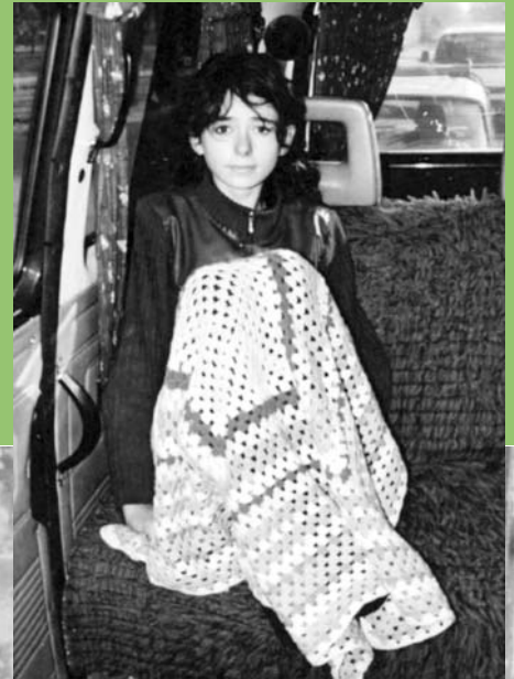
Skakande, svag flicka på väg till ett nytt liv.