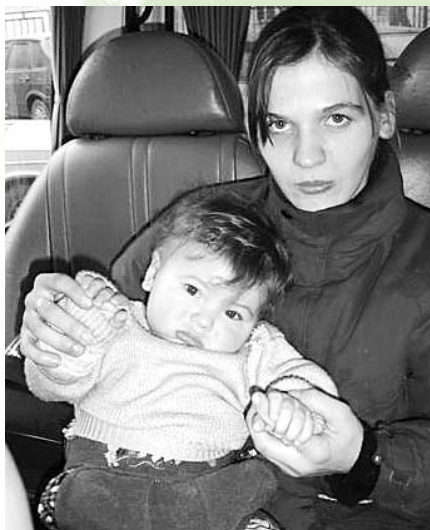
Den unga mamman har bestämt sig: mot Jaroslavs rehabiliteringscenter.

Nu finns det ett hopp om ett bättre liv för den unga mamman och det lilla barnet!