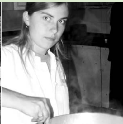
Flickan blev en duktig kock.